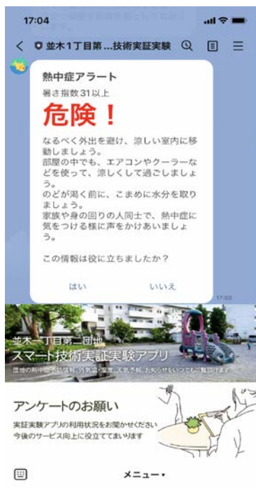
[LINE アプリ/熱中症アラート]