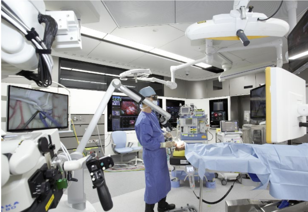
スマート手術室での脳外科手術(イメージ)

データの伝送には、ドコモのクラウドサービス「ドコモオープンイノベーションクラウド」を使用します。これにより手術のデータを高セキュリティに、また大容量データを低遅延 ※4 で伝送することが可能です。スマート治療室内の複数の医療機器データ管理は、医療情報統合プラットフォームの「OPeLiNK(オペリンク) ® 」 ※5 を活用します。