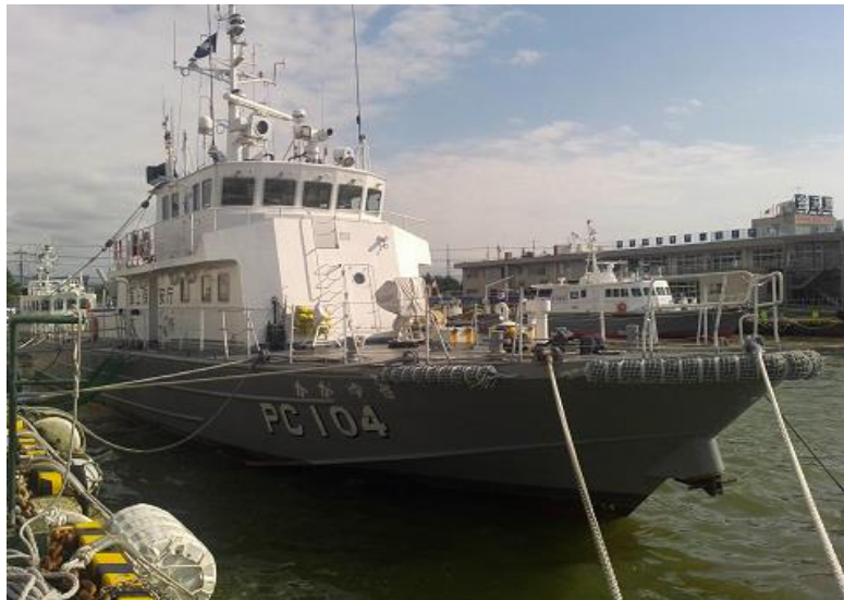
巡視艇「かがゆき」（型式：PC104）