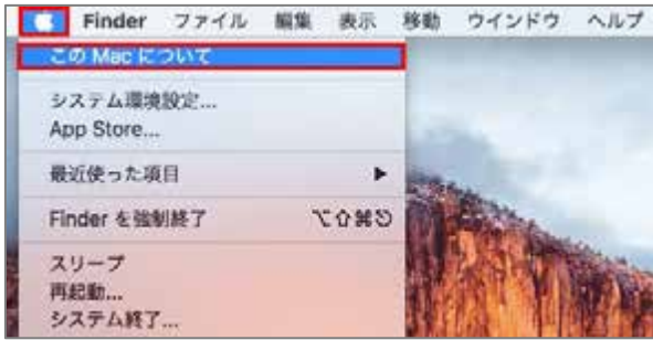
④ アップルメニュー

アップルメニューをクリックします。続けて「このMacについて」をクリックします。