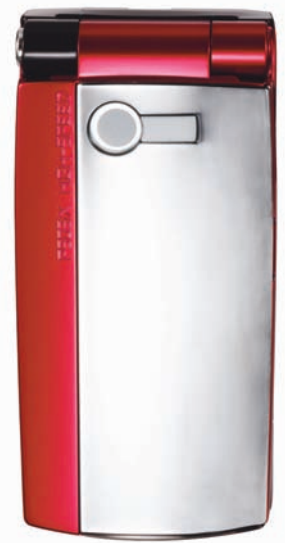
右ボタン iモードボタン