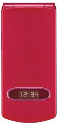
メニューボタン 決定ボタン

対応メモリーカード: microSD(最大2Gバイトまで) microSDHC(最大16Gバイトまで)