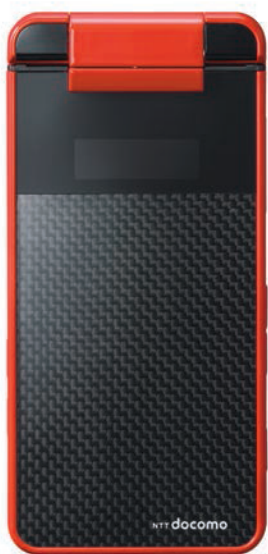
メニューボタン iモードボタン

対応メモリーカード: microSD(最大2G/バイトまで) microSDHC(最大8G/バイトまで)