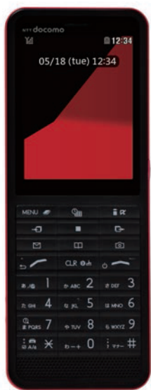
メニューボタン iモードボタン

対応メモリーカード: microSD(最大2Gバイトまで) microSDHC(最大8Gバイトまで)