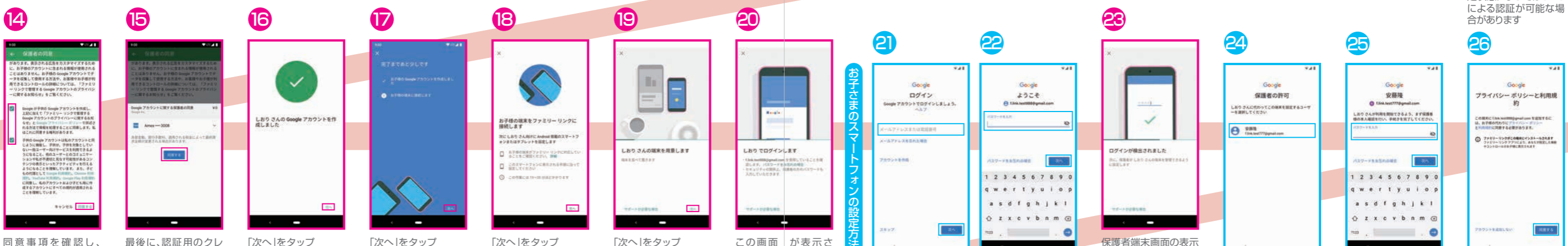
14 同意事項を確認し、チェックボックスにチェックを入れて「同意する」をタップ 15 最後に、認証用のクレジットカード情報が表示されるので、「同意する」をタップ 16 「次へ」をタップ 17 「次へ」をタップ 18 「次へ」をタップ 19 「次へ」をタップ 20 この画面が表示されたら、次にお子さまが使用する端末側での設定を行います。