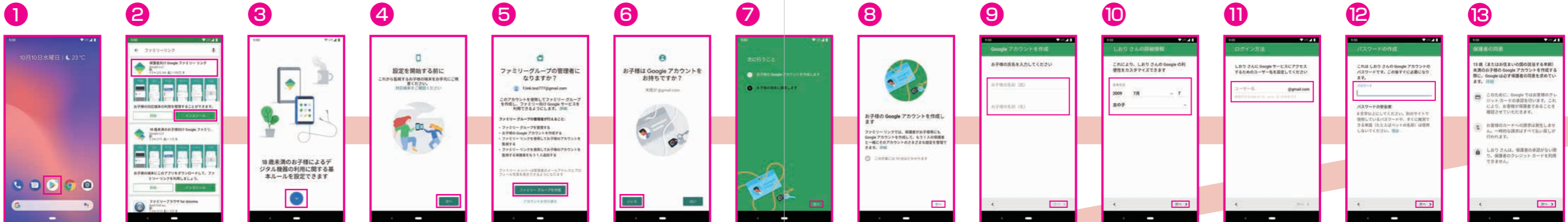
1 Google PlayストアもしくはAppストアを起動し、ファミリーリンクを検索 2 保護者用のファミリーリンクアプリをインストール後「開く」をタップ 3 「↓」をタップし画面遷移後「試してみる」をタップ 4 「次へ」をタップ 5 「ファミリーグループを作成」をタップ 6 「いいえ」をタップ 7 「次へ」をタップ 8 「次へ」をタップ 9 お子さまの氏名を入力して「次へ」をタップ 10 お子さまの生年月日、性別を入力して「次へ」をタップ 11 お子さまが使用するGoogleアカウントを入力して「次へ」をタップ 12 お子さまが使用するGoogleアカウントのパスワードを入力して「次へ」をタップ 13 保護者の同意画面に進むので、「次へ」をタップ。なお、保護者様のGoogleアカウントの設定状態によってはSMSによる認証が可能な場合があります