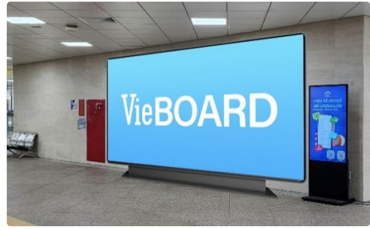
«ホーチミンメトロ駅構内のデジタルサイネージ» (サイズ：最大 6,000mm (W) ×2,000mm (H) )