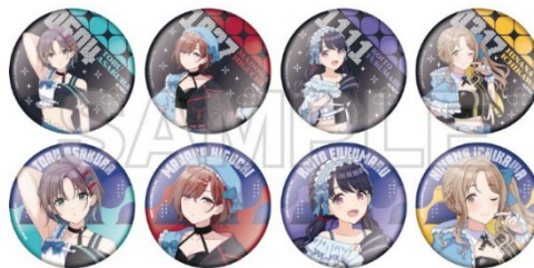
THE IDOLM@STER™ & ©Bandai Namco Entertainment Inc.