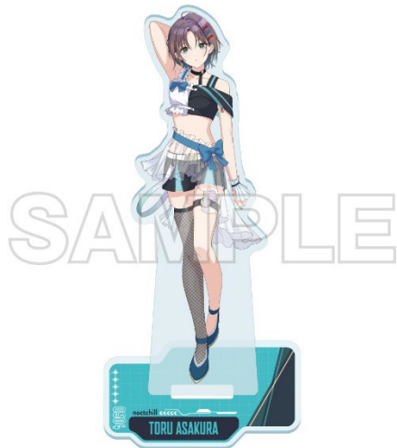
THE IDOLM@STER™ & ©Bandai Namco Entertainment Inc.