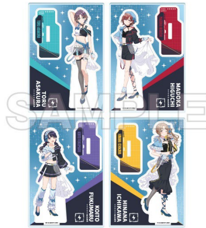
THE IDOLM@STER™ & ©Bandai Namco Entertainment Inc.