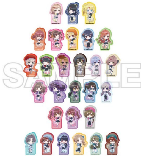
THE IDOLM@STER™ & ©Bandai Namco Entertainment Inc.