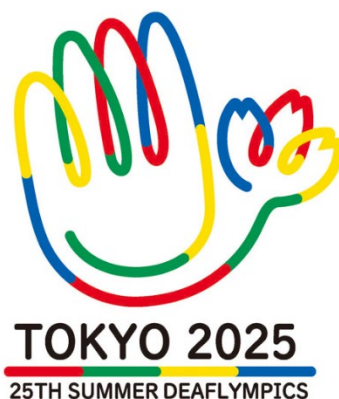
東京 2025 デフリンピック大会エンブレム

株式会社 NTT ドコモ（以下、ドコモ）の決済サービス「d 払い ® 」は、2025年11月に開催される「第25回夏季デフリンピック競技大会 東京 2025（以下、東京 2025 デフリンピック）」のキャッシュレス募金に採択されました。本対応期間は、2025年2月21日（金）から2025年11月30日（日）まで ※1 です。