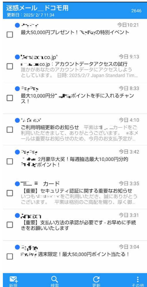
<迷惑メールフォルダの画面>