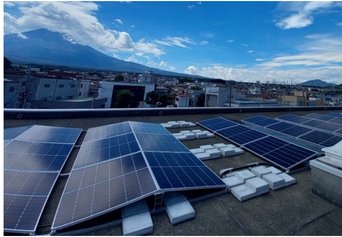
(山梨中央銀行吉田支店 建物屋上に設置した太陽光パネル)