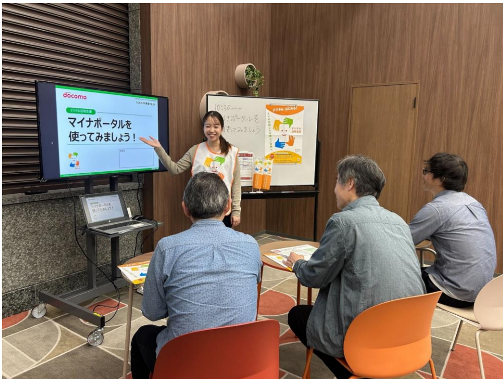
<対象となる講座を開催する「スマホ教室」の実施イメージ>

本事業の対象となる講座は、お客さまから大変ご好評いただいている「マイナンバーカードの申請方法」「マイナポータル の活用方法 」「マイナンバーへの健康保険証と公金受け取り口座の登録方法」「オンライン診療の活用方法」「全国版救急受診アプリ（Q助）の活用方法」の 5 講座に、今年度新たに「スマホ用電子証明書を利用してみよう」「ハザードマップポータルサイトで災害のリスクを確認してみよう」「デジタルリテラシーを身につけて安全にインターネットを楽しもう」の 3 講座を加え、計 8 講座となります。