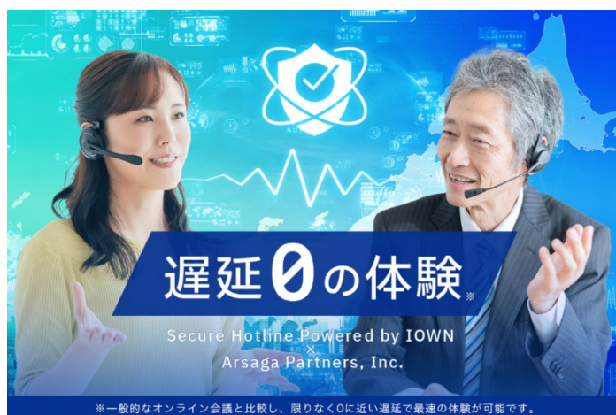
サービスイメージ

アルサーガパートナーズ株式会社（以下、アルサーガパートナーズ）、東急不動産株式会社（以下、東急不動産）、日本電信電話株式会社（以下、NTT）、株式会社 NTT ドコモ（以下、ドコモ）は、2024年2月14日（水）に IOWN を活用した次世代サービス開発に関する協業に向けた検討（以下、本検討）に合意いたしました。渋谷から IOWN を活用したサービスを開発・発信し、広域渋谷圏 ※1 だけでなく他の街にも導入を拡大していくことで新しいエンタメ・ビジネス体験を創出していくことをめざし検討を開始します。その第一歩として、APN IOWN 1.0 ※2 を活用したリモート会議システム「Secure Hotline Powered by IOWN ※3 」（以下、本サービス）の開発について検討します。