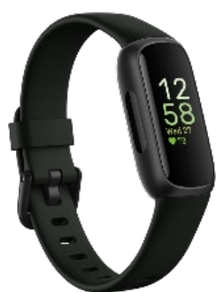
<ミッドナイトゼン/ブラック>

アウトに取り組めるかの判断やストレスに適切に対処できているかのチェックに役立ちます※2。カラーは「ミッドナイトゼン/ブラック」と、「ライラックブリス/ブラック」の2色を発売いたします。