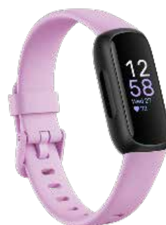
<ライラックブリス/ブラック>