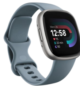
<ウォーターフォールブルー/プラチナルミニウム>

「Ace 3」は、6 歳以上のお子さま向けのモデルで、運動や睡眠などを記録し、ご家族と一緒に健康習慣を身に付けられるアクティビティトラッカーです。快適なシリコンベルトでしっかり固定する調整可能な留め具を使用しており、お子さまのさまざまな動きに対応します。カラーは、「ブラック/スポーツレッド」と、「コズミックブルー/アストログリーン」の 2 色を発売いたします。