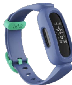
<コズミックブルー/アストログリーン>

「Inspire 3」は、身に着けるだけで、ストレス、健康、睡眠を管理できるトラッカーです。推定皮膚温や血中酸素ウェルネスなどの健康指標 *1 を追跡でき、「今日のエナジースコア」や「ストレスマネジメンドスコア」で、どれだけハードなワーク