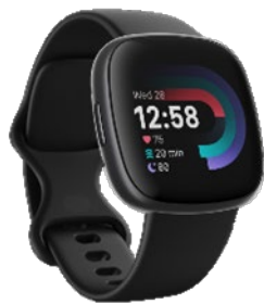
<ブラック/グラファイトアルミニウム>

「Versa 4」は、健康管理のために設計された、軽量で快適な装着感のスマートウォッチです。自分のコンディション情報に基づいてワークアウトに適した状態か、休息を優先すべきかがわかり、かつおすすめのワークアウトが表示される「今日のエナジースコア」や、GPS 搭載でスマートフォンなしでも、屋外でのワークアウト中にペースと距離がリアルタイムに表示される機能、その他「Fitbit Pay」など、さまざまな機能を手首のスマートウォッチで利用できます。カラーは、「ブラック/グラファイトアルミニウム」と「ウォーターフォールブルー/プラチナルミニウム」の 2 色を発売いたします。