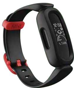
<ブラック/スポーツレッド>

「Ace 3」は、6 歳以上のお子さま向けのモデルで、運動や睡眠などを記録し、ご家族と一緒に健康習慣を身に付けられるアクティビティトラッカーです。快適なシリコンベルトでしっかり固定する調整可能な留め具を使用しており、お子さまのさまざまな動きに対応します。カラーは、「ブラック/スポーツレッド」と、「コズミックブルー/アストログリーン」の 2 色を発売いたします。