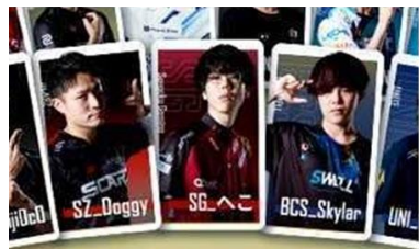
<PMJL SEASON2オリジナルの選手カード>

なお、「Xperia Stream for Xperia 1 IV」の購入者先着 150 名さま ※2 に PMJL SEASON2 オリジナルの選手カード（1 枚） ※3 、PUBG クリアファイル（1 枚） ※3 、PUBG ステッカー（1 枚）のグッズセットを進呈いたします。 ※4