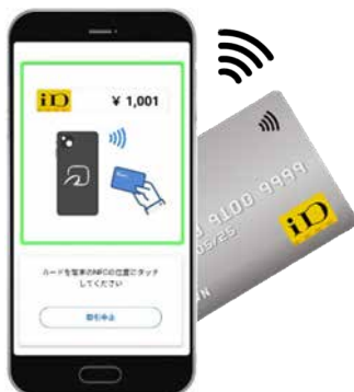
iD 対応カードでのお支払い