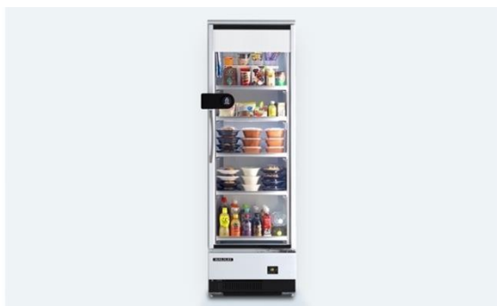
スマートスタンドの外観

スマートスタンドでは、お弁当やデザート、ドリンク、お菓子などの食料品や日用品など、幅広い商品を取り扱うことが可能です。また、専用アプリのチャット機能を通じて、置いてほしい商品をリクエストすることで、スマートスタンドの利用者に最適化された品揃えが可能となります。さらに、商品の価格はダイナミックプライシングを適用しており、賞味期限が近い商品の廃棄ロスを削減することができます。