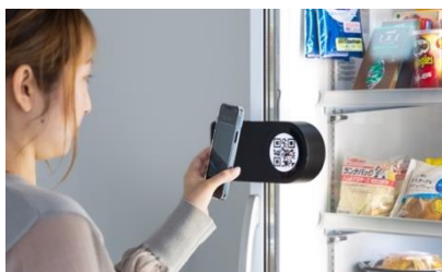
step2:QRコードでロック解錠