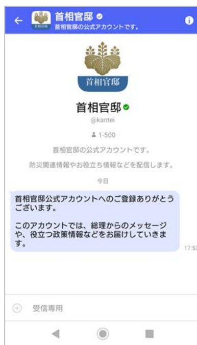
<「首相官邸」公式アカウントイメージ>

「首相官邸」公式アカウントは、内閣官房内閣広報室が運用し、防災関連情報や総理からのメッセージ、内閣が取り組む重要政策などについて配信を行う予定です。