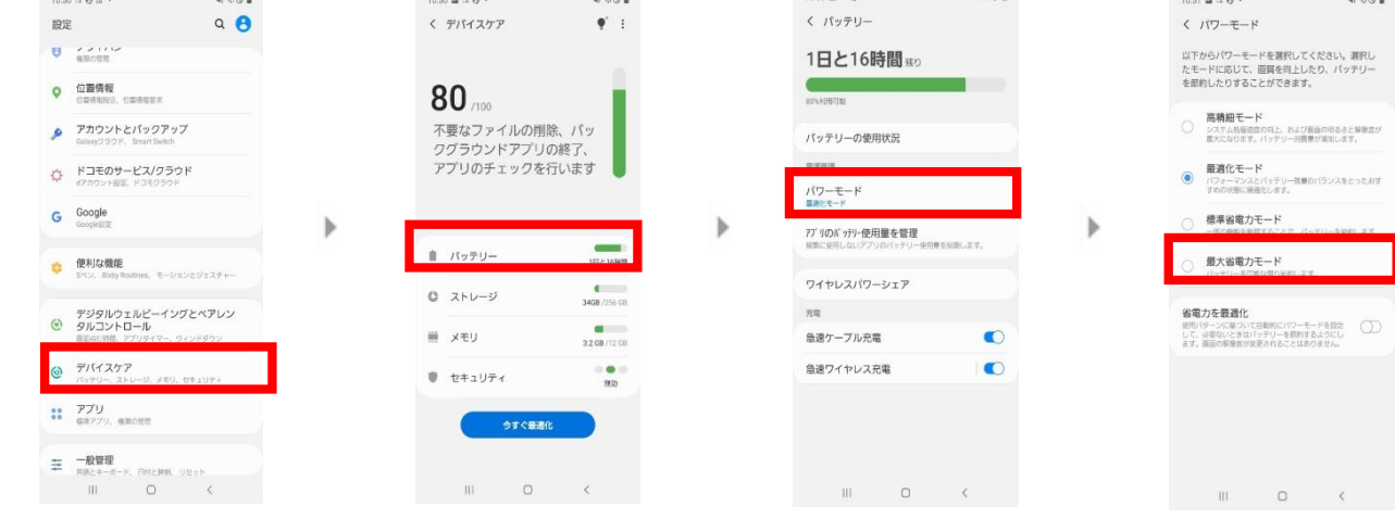
【1】「デバイスケア」を選択