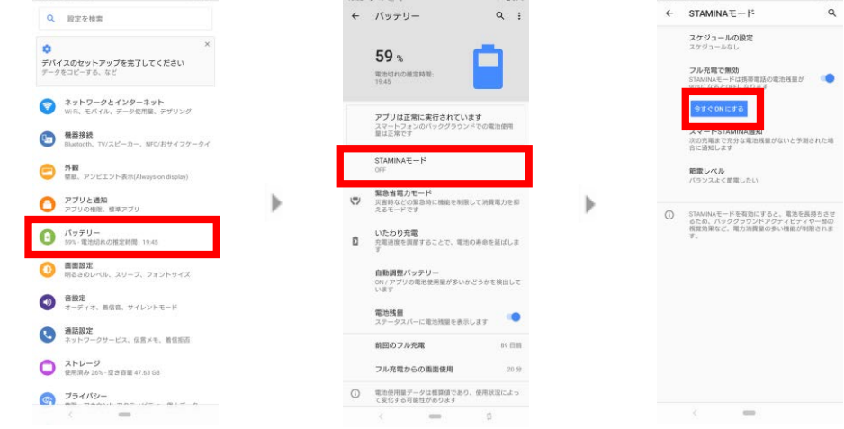
【1】「バッテリー」を選択