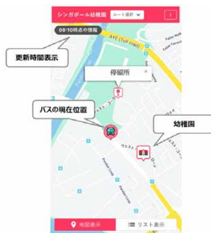
<バスロケーションサービスの画面イメージ>

そこで本実証実験は、Japanese Kindergarten Singapore Pte Ltd.（日本名：シンガポール日本人幼稚園）、Konohana International Pte Ltd.（日本名：このはな幼稚園）の2園で行い、保護者および幼稚園管理者の利便性向上、負担軽減効果、位置測定精度の検証などを実施します。