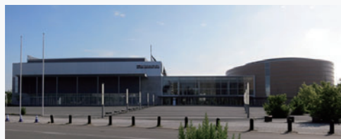
写真1 札幌コンベンションセンター

展示では当該規格対応端末4台を使用し（うち1台はHDMI（High-Definition Multimedia Interface）により外部モニタに出力）、LTEを利用して、d