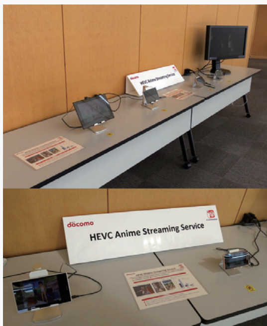
写真2 dアニメストアの展示

ドコモはこれまで、技術提案と標準化推進の両面から当該規格策定に貢献してきましたが、今回のdアニメストアの披露展示は、ドコモのH.265/HEVC商用サービス開始を世界に向けてアピールする良い機会となりました。