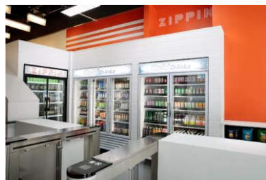
米国の店舗(サンフランシスコ)