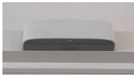
省電力の人感センサーで 入店者数を検知