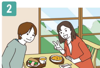
カフェでとった じぶん しゃしん 自分とともだちの写真