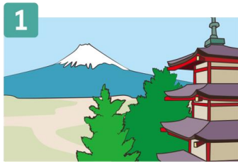
しゅうがくりょこう 修学旅行でとった ふうけい しゃしん 風景の写真