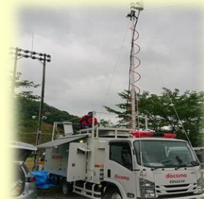
移動基地局車による エリア救済

※基幹中継伝送路においても破断が発生しましたが、これまで実施してきたNW強化対策(伝送路多ルート化による冗長構成)によりサービスの継続を行いました。