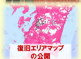
復旧エリアマップ の公開