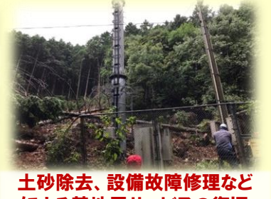
土砂除去、設備故障修理など による基地局サービスの復旧