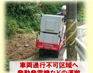
車両通行不可区域へ 発動発電機などの運搬