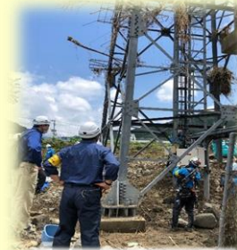
水没基地局設備 及び伝送路復旧