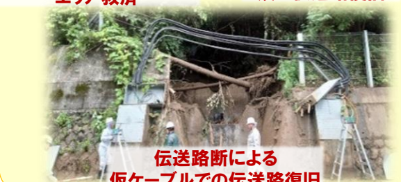
伝送路断による 仮ケーブルでの伝送路復旧