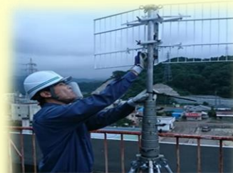
フェイスガード着用による 設備復旧

フェイスガードやゴーグル等を着用しコロナ感染予防対策を講じコロナ禍での災害対応を実施しました。