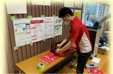
ゴーグル着用による 避難所支援