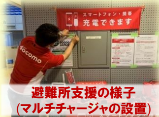
避難所支援の様子 (マルチチャージャの設置)